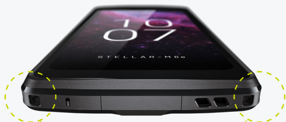
2 encoches pour glisser un tour de cou